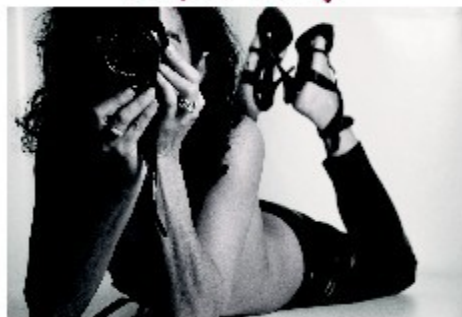
"Blow up" fotografia