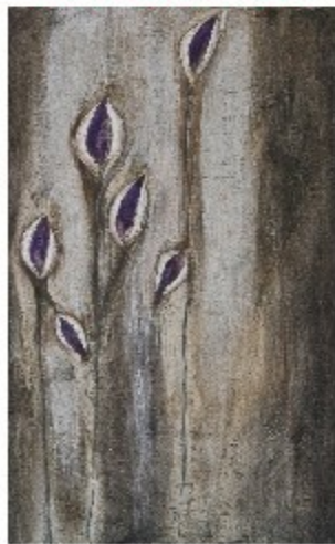
"Anime fragili" tecnica mista