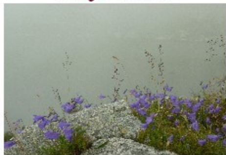
"Pietre e fiori" fotografia