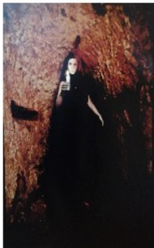
"La maschera" fotografia