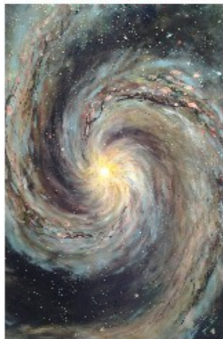
"Galassia su tela" tecnica mista