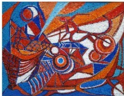
"Senza confini" tecnica mista