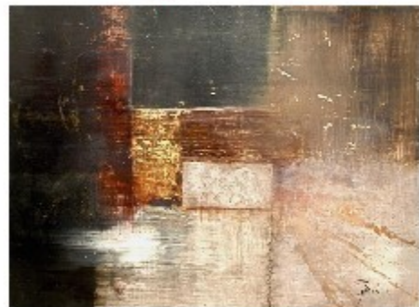
"Tunnel" olio su tela