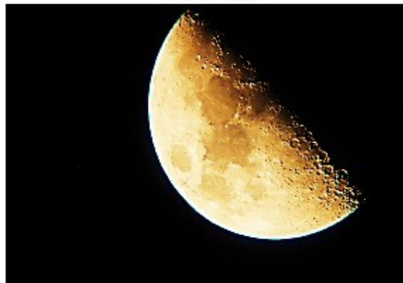
"Mezza luna rossa" fotografia