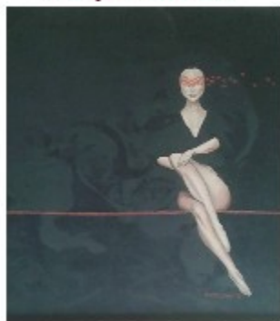
"La maschera" olio su tela