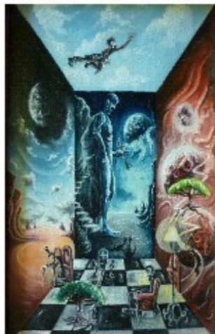
"La stanza dei sogni" olio su tela