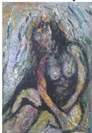
"Il nudo" tecnica mista